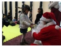
サンタさん、ありがとう