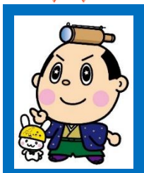
山本 ひまり (滋賀県)