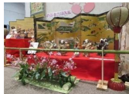
展示中のひな人形