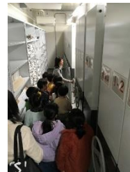
書庫の中へ 入ったよ