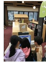
読みたい本は あったかな