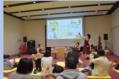
さあ!丘の上までしゅっぱつ!