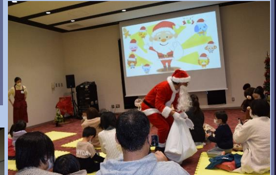
サンタさんからのプレゼント!